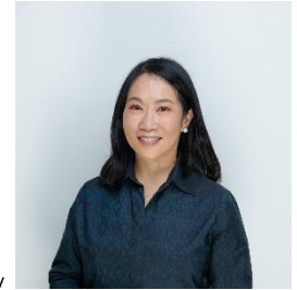
เสนอเป็นกรรมการ

อายุ 55 ปี รองกรรมการผู้จัดการใหญ่อาวุโส ฝ่ายบริหารการเงิน บมจ. เซ็นทรัล รีเทล คอร์ปอเรชั่น