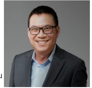
เสนอเป็นกรรมการอิสระ

อายุ 60 ปี ประธานกรรมการอิสระ/ประธานกรรมการ สรรหาและพิจารณาค่าตอบแทน 26 กุมภาพันธ์ 2565 – ปัจจุบัน ตั้งแต่วันที่ 26 กุมภาพันธ์ 2565 รวมดำรงตำแหน่งกรรมการอิสระ 2 ปี 2 เดือน