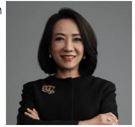
เสนอเป็นกรรมการ